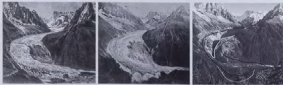
Mer de Glace visto desde la perspectiva de La Flégère, con vista al valle de Chamoni (area del Mont Blanc). Izquierda: dibujo ideado, copia de Samuel Birnbaum del año 1823. El imponente avance del glaciar amenaza a los habitantes del valle (Kunstmuseum Basel, Kupferstichkabinett, reproducción de H.J. Zumbühl). Centro: Fotografía de Henri Fluat entre 1879 y 1880, cuando el glaciar comenzó a retroceder (colección de H. Wolf). Derecha: Vista actual. El Mer de Glace ha retrocedido hacia el valle lateral, proceso que se muestra con la reconstrucción de su extensión en 1844 (gris, la mayor extensión), 1821 (negro) y 1895 (blanco) (fotografía de la autora).